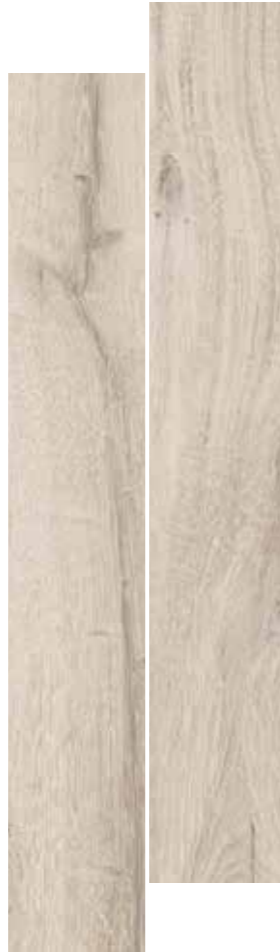
AVORIO 20,5x120,5 8"x48"