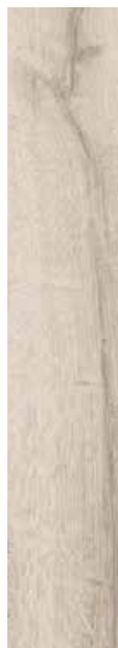
AVORIO 15x90 6"x36"