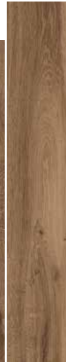
NOCCIOLA GRIP 15x90 6"x36"