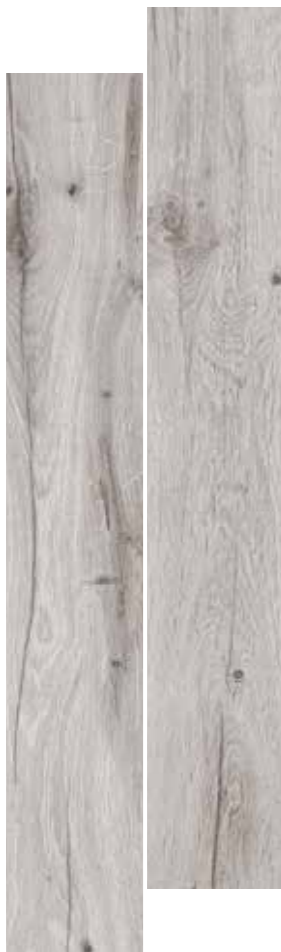
GRIGIO 20,5x120,5 8"x48"