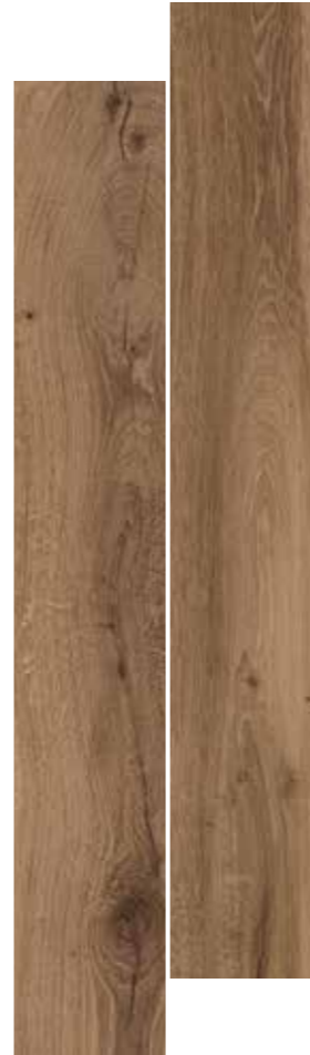
NOCCIOLA 20,5x120,5 8"x48" NOCCIOLA GRIP 20,5x120,5 8"x48"