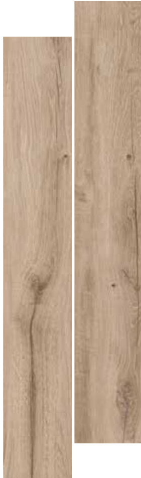
MIELE 20,5x120,5 8"x48" MIELE GRIP 20,5x120,5 8"x48"