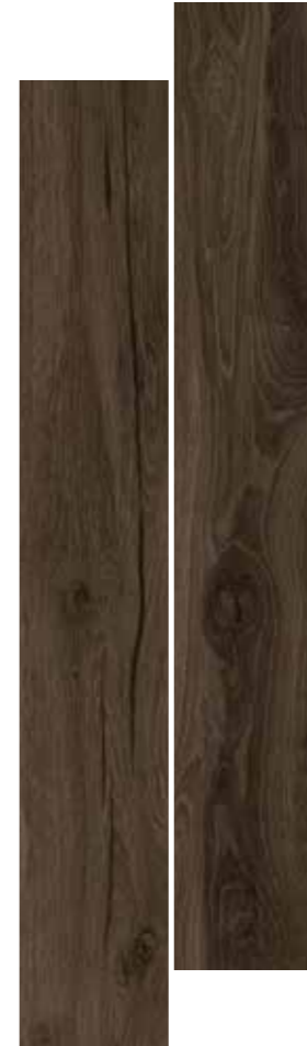
WENGÈ 20,5x120,5 8"x48"