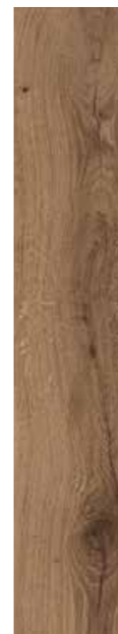
NOCCIOLA 15x90 6"x36"