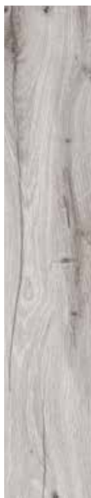
GRIGIO 15x90 6"x36"