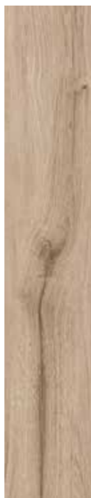
MIELE 15x90 6"x36"