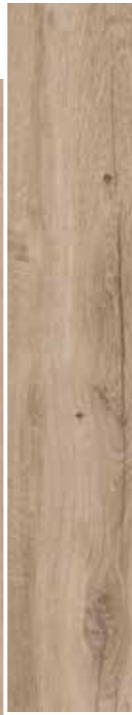
MIELE GRIP 15x90 6"x36"